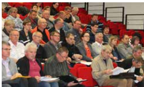
Conseil Communautaire commun - Bignan le 4 mai 2016

Avancer ensemble vers un projet commun et dans la même direction politique est la priorité des élus dans le cadre de cette démarche de fusion. Cette volonté est la garantie d'une gestion territoriale efficace dont l'objectif est d'apporter un service de proximité adapté à l'échelle de la nouvelle intercommunalité. Le territoire de Centre Morbihan Communauté a été pensé en tenant compte de ses spécificités, de ses contraintes mais aussi de ses forces, et bien sûr des pratiques et des expériences réussies de chaque Communauté de communes.