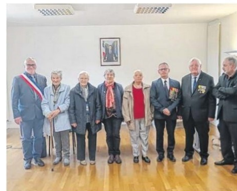
Remise d'insignes lors de la commémoration du 8 Mai 1945

Un grand merci à la municipalité pour son accueil chaleureux et son implication active au sein de l'association.